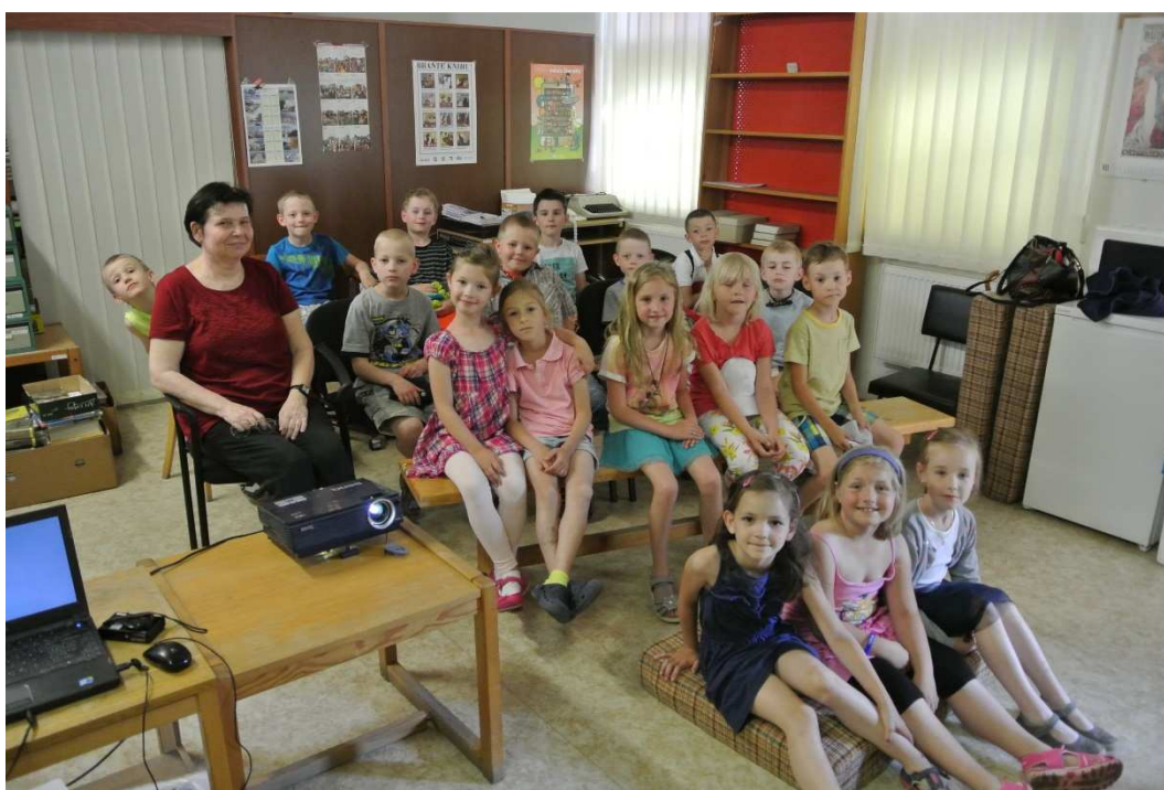
1.C v knihovně