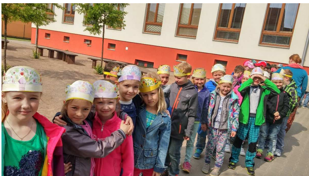
Projekt Karel IV. - 1.C výroba koruny