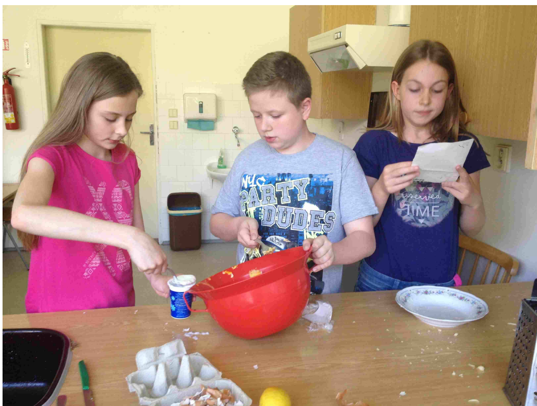
Pracovní činnosti . příprava pomazánky