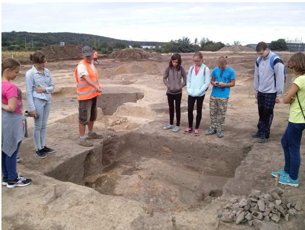
Archeologie 7. třída

V rámci školní družiny pak fungovaly pěvecké sbory Zpěváček a Zpěvandule a kroužek hry na zobcovou flétnu. Spolupráce pokračovala i s taneční skupinou X-trim.