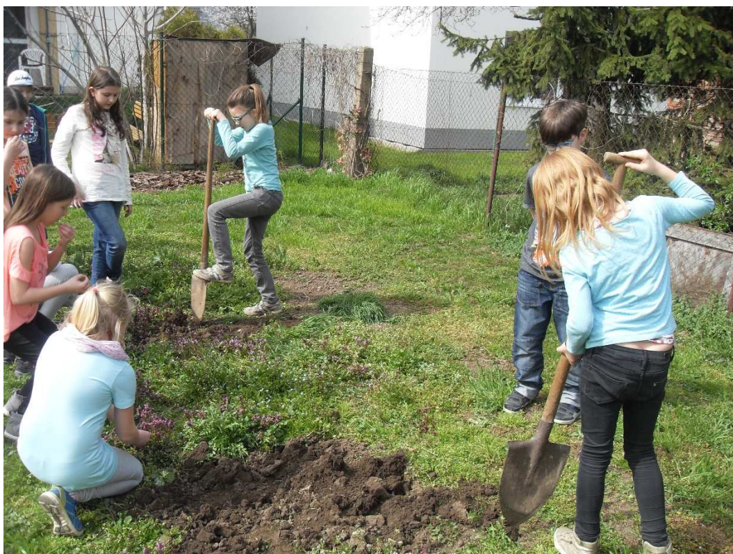
Práce na pozemku