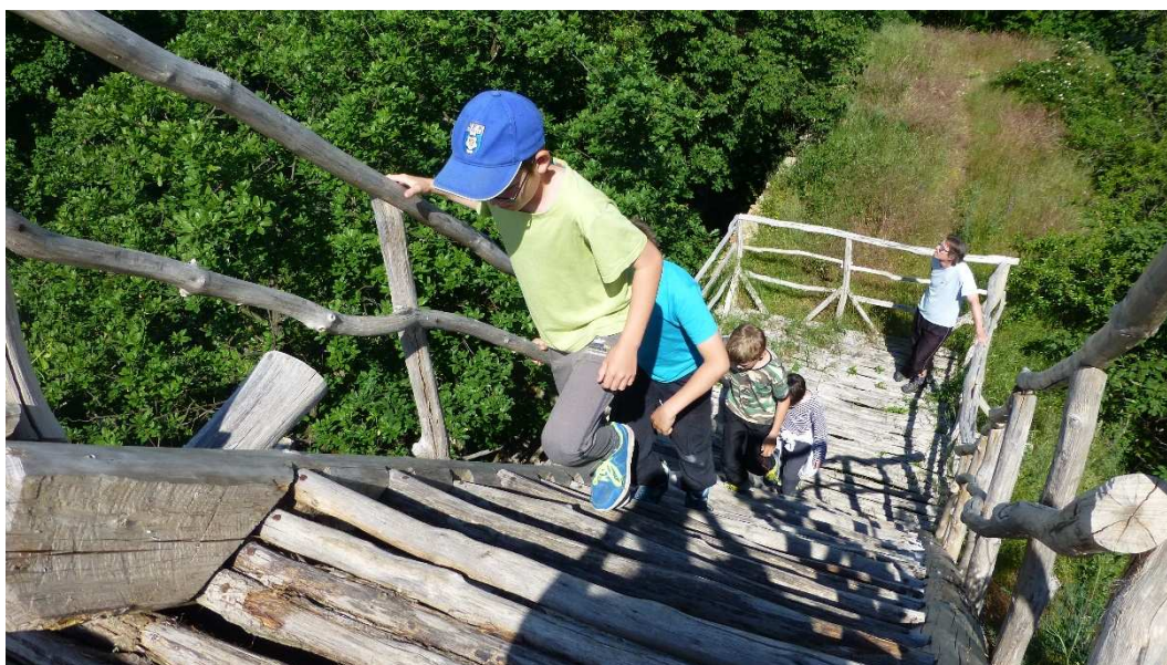
Škola v přírodě