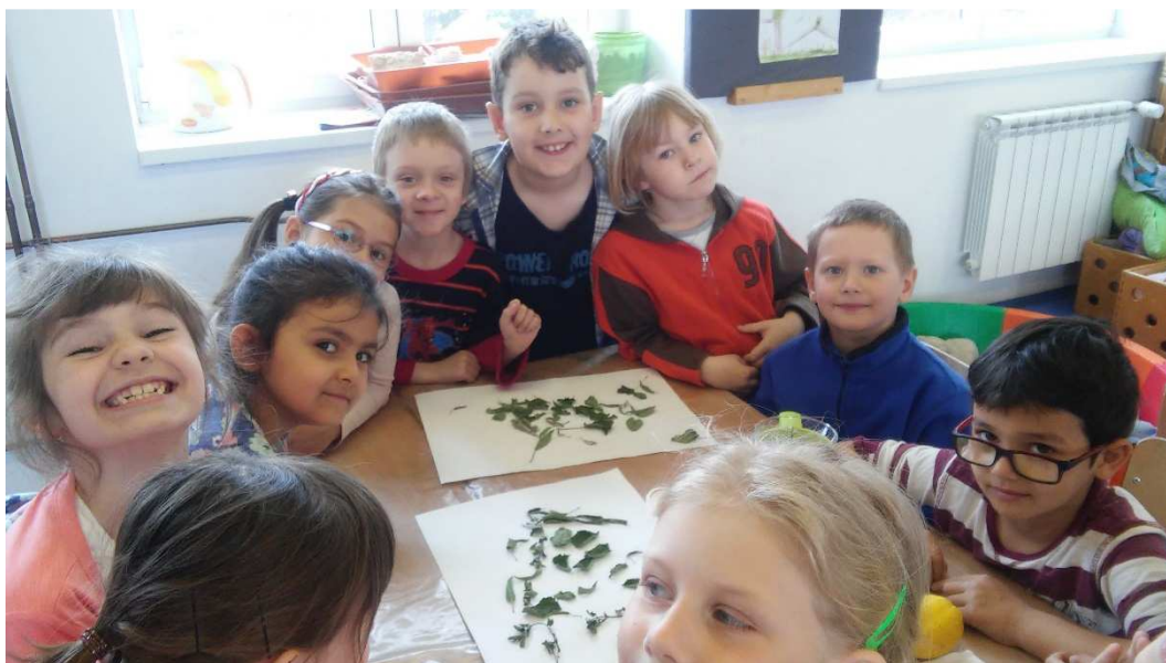
Eko týden - sběr bylinek a vaření čaje

Den Země. 2. stupeň Den Země oslavil sběrem a hlavně tříděním odpadů v okolí Modřic. Akce ve spolupráci s městem Modřice v rámci celorepublikového projektu Uklidme Česko.