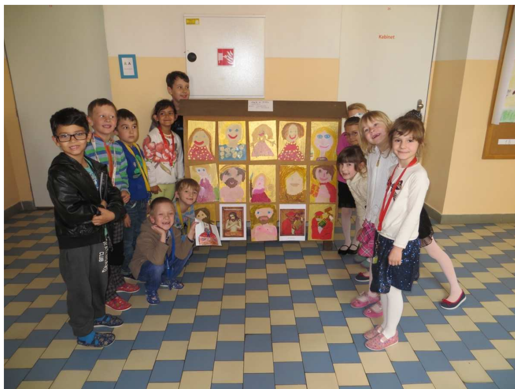
Projekt Karel IV.