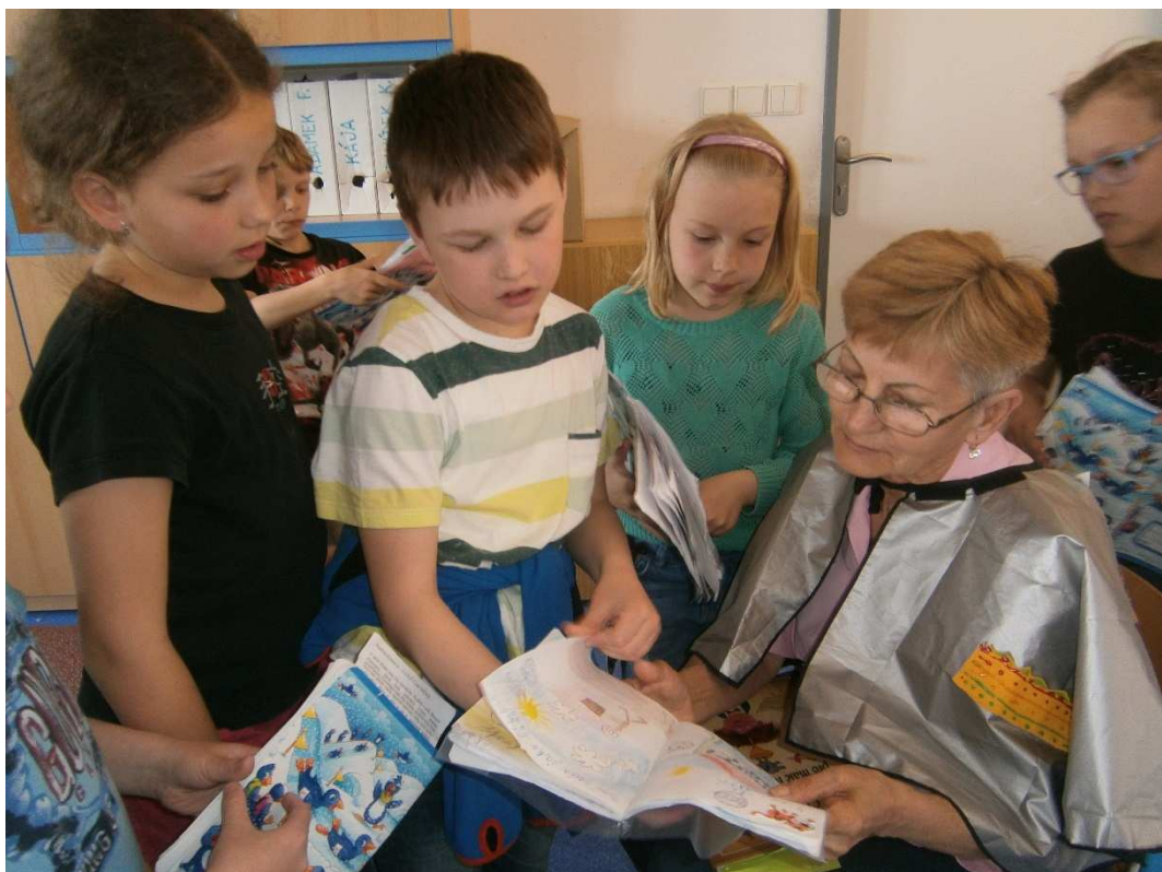
Projekt Babička a dědeček do školní družiny