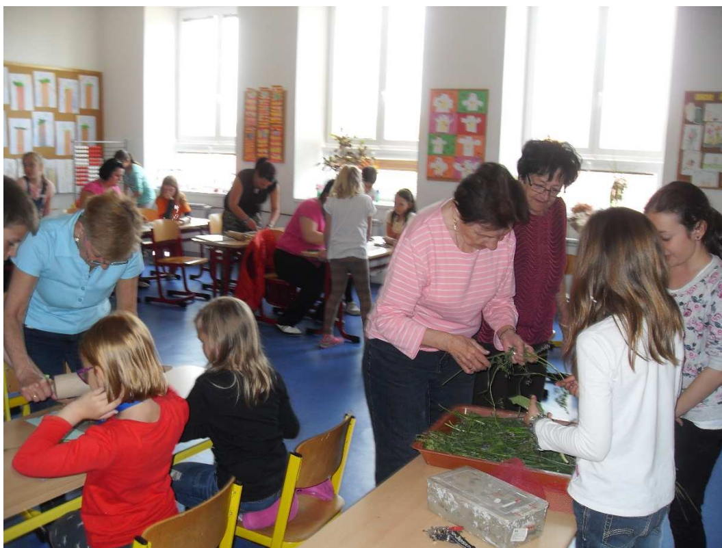
2. oddělení - práce se seniory