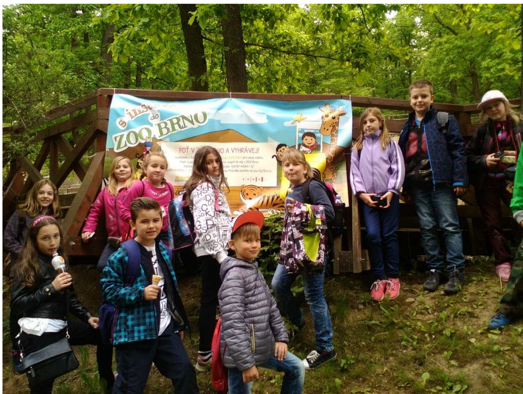
3.A v ZOO