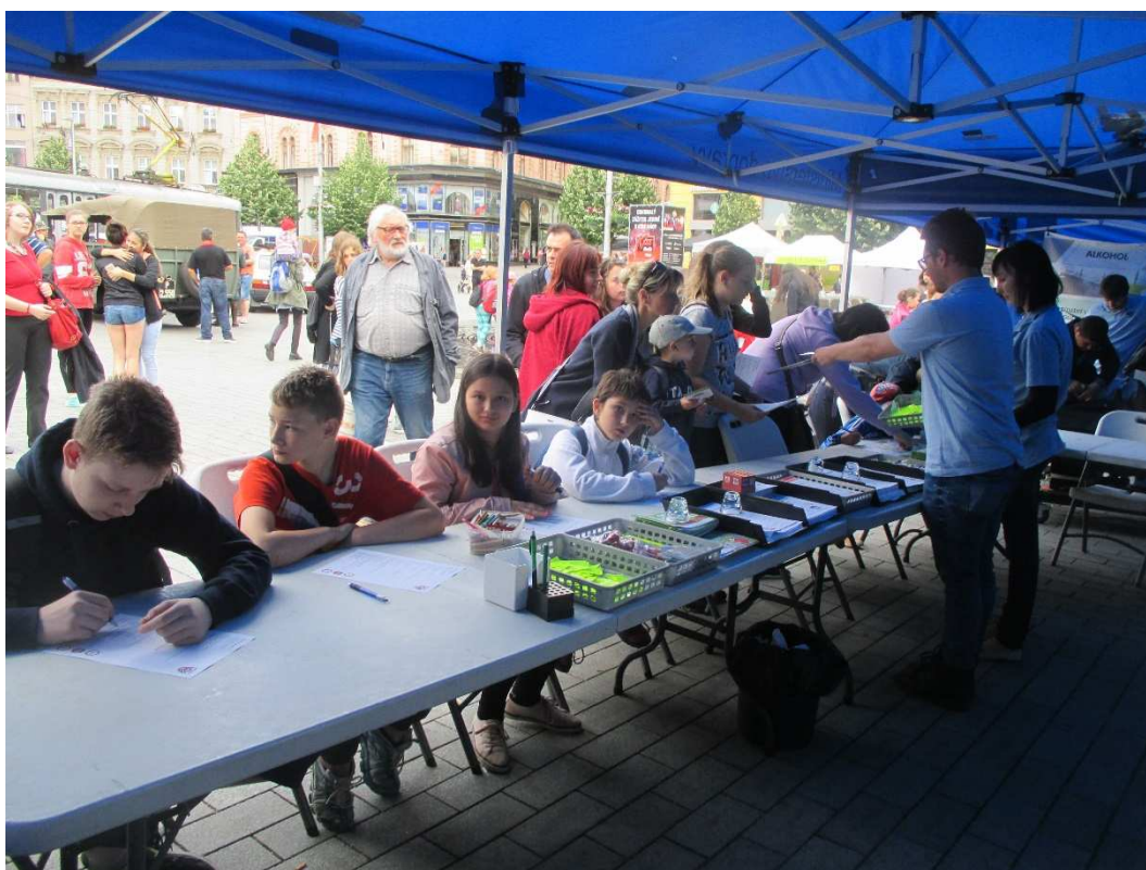
Dopravní výchova - Den PČR