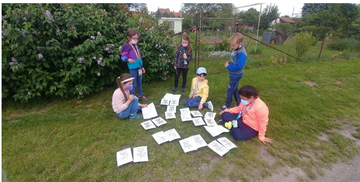
Venkovní hra k oslavě Dne dětí