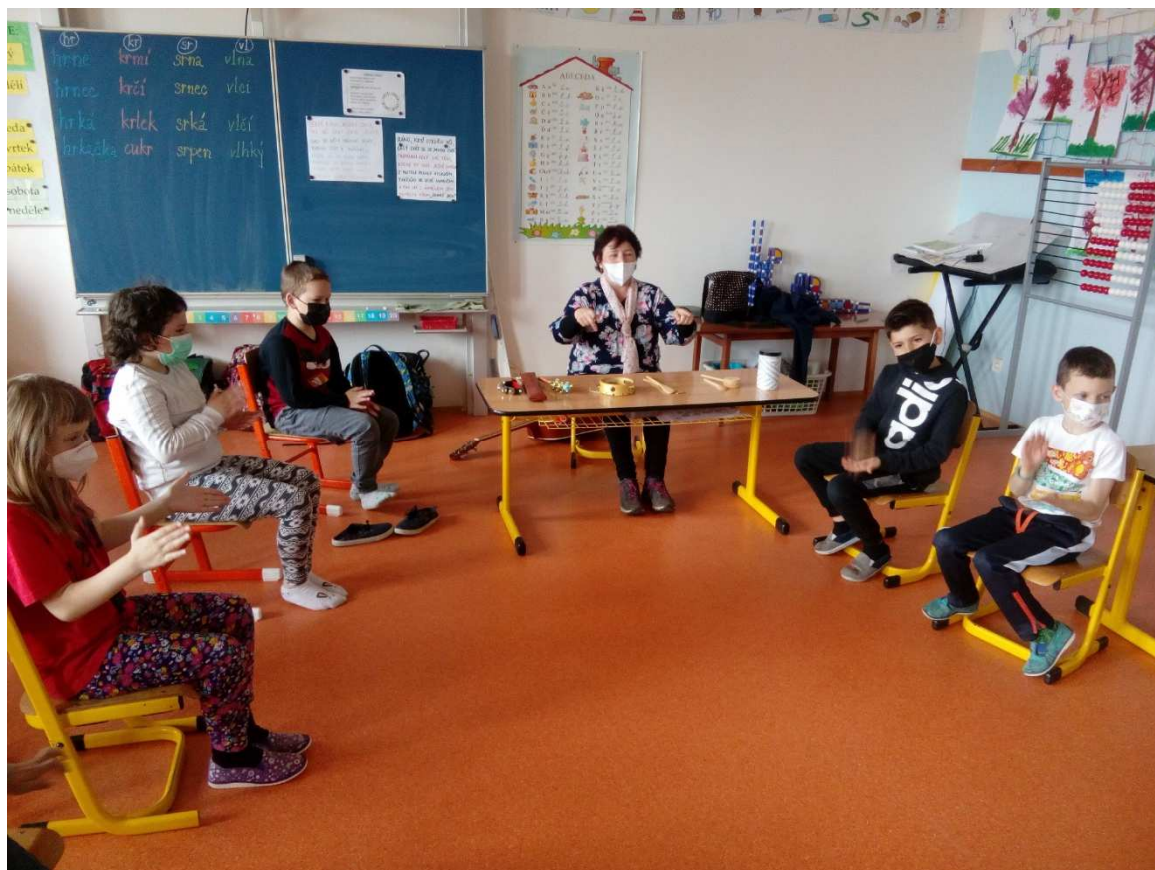
Muzicírování v ŠD