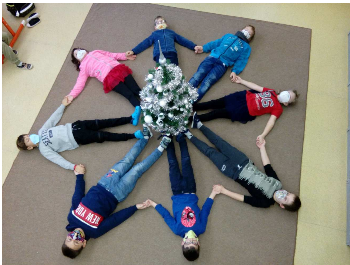
Vánoce v ŠD

Jako největší problém se jeví motivace žáků k práci i k získání dobrých známek. U starších žáků klesá zájem o poznání jako takové. To se především odráželo v aktivitě a přístupu k distanční výuce.