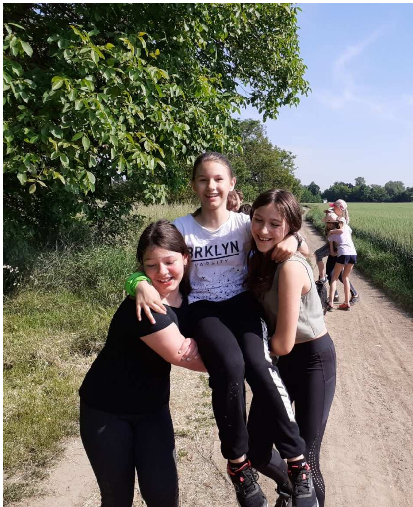
Základy zdravotvdy - přenášíme zraněného