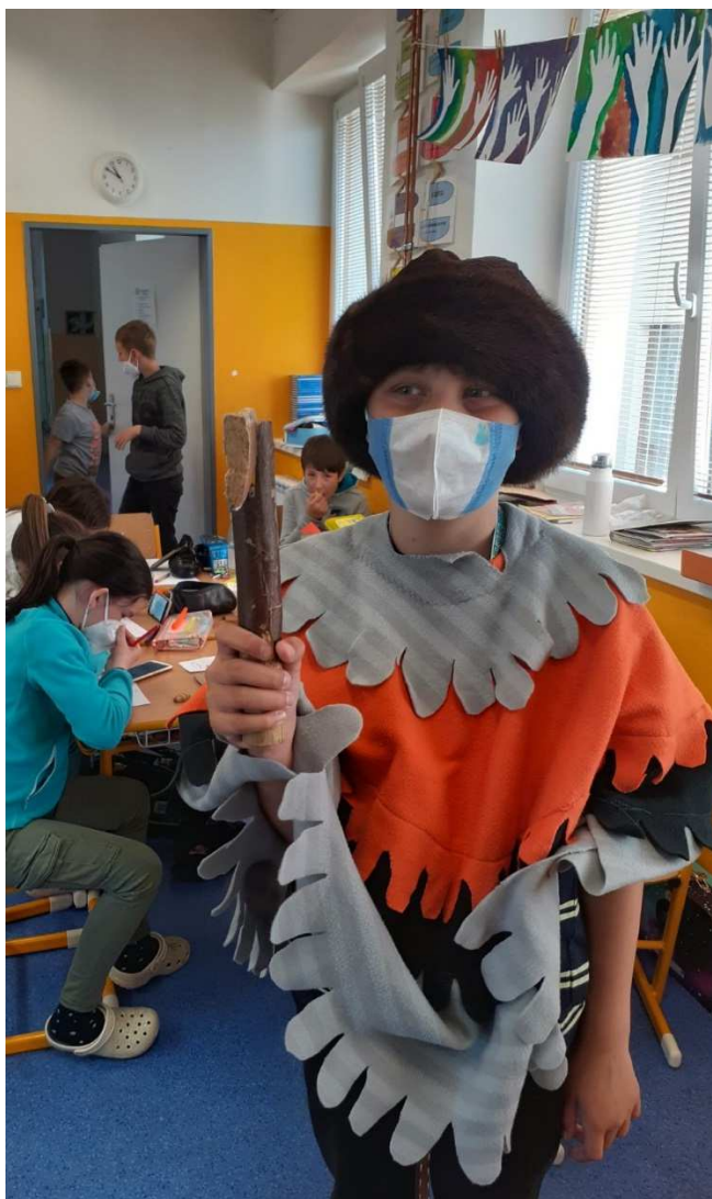
Jak se žilo ve středověku

Děti přípravné třídy i žáci 1. – 9. ročníku byli zapojeni do projektu Ovoce a mléko do škol.