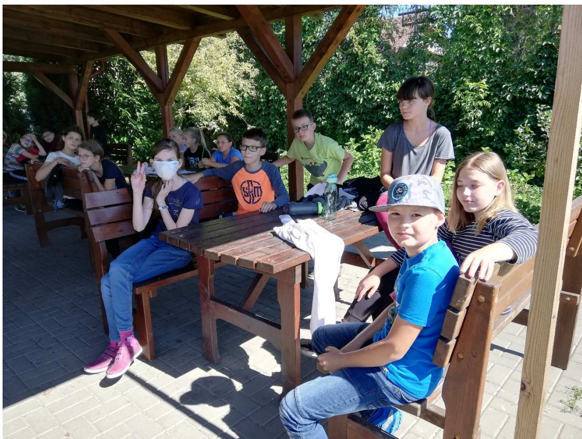
Obrázek 1Adaptační program 6.B

I letošní rok byl výrazně poznamenán karanténními opatřeními, kdy jsme velkou část roku nemohli chodit do školy a ani absolvovat preventivní programy. Kontakt s žáky udržovali všichni třídní učitelé díky každotýdenním třídnickým hodinám (45 minut). Pokud měli žáci nějaký problém, byla k dispozici školní psycholožka, aby pomohla. Pokud někdo z žáků pracoval málo nebo vůbec, byl o tom informován třídní učitel, který věc řešil s rodiči. Neměli jsme žádné žáky, kteří by při distanční výuce vůbec nepracovali. Po návratu na prezenční výuku bylo s žáky nadále pracováno zejména s ohledem na to, aby se psychicky vypořádali s tlakem, který cítili při návratu na prezenční výuku.