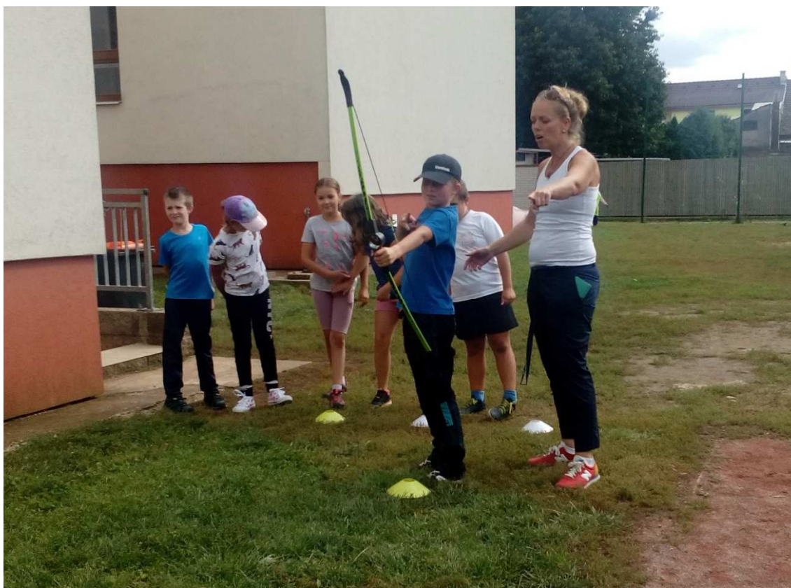
Tygřík v ŠD