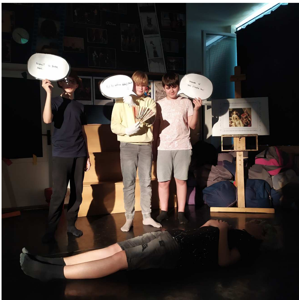
Nad hrobem Františka Štěpána Lotrinského – dramatická výchova