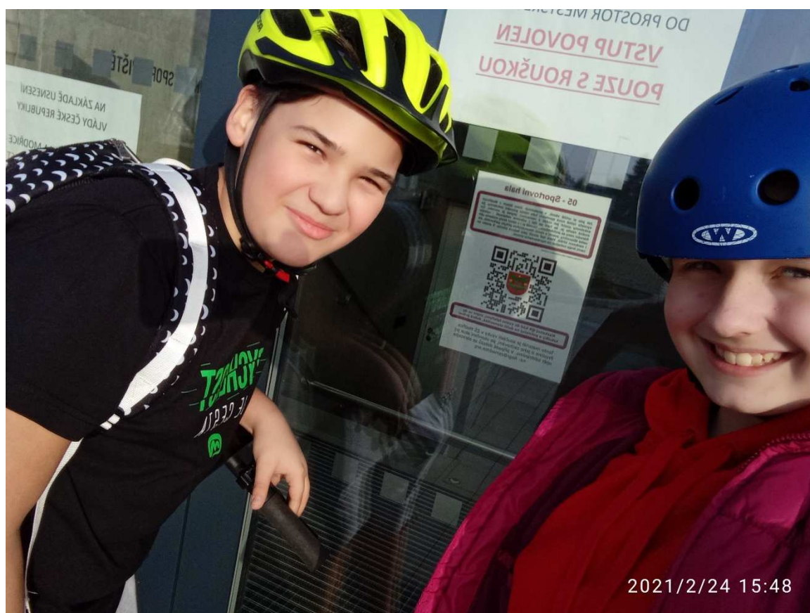
Distanční výuka QR kódy