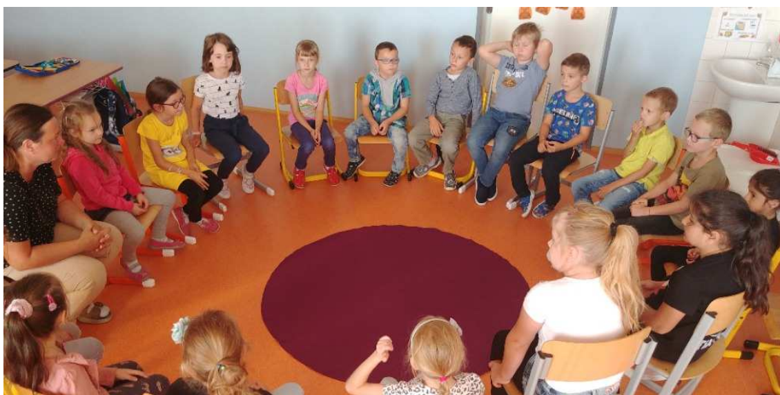
Výukový program 1.A Poklady českého nebe