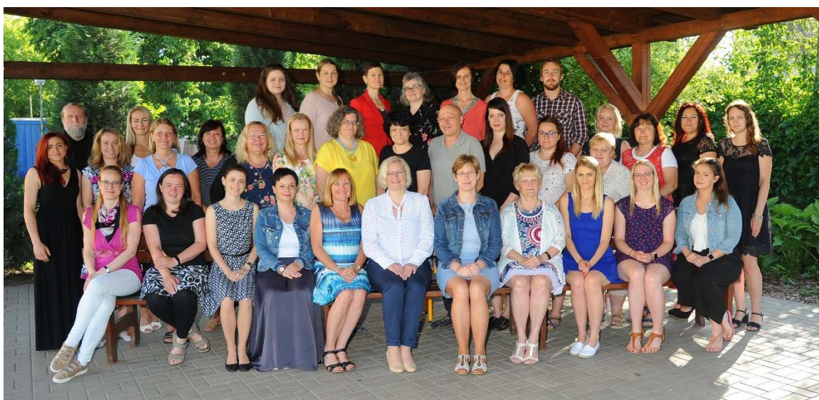
Část pedagogického sboru