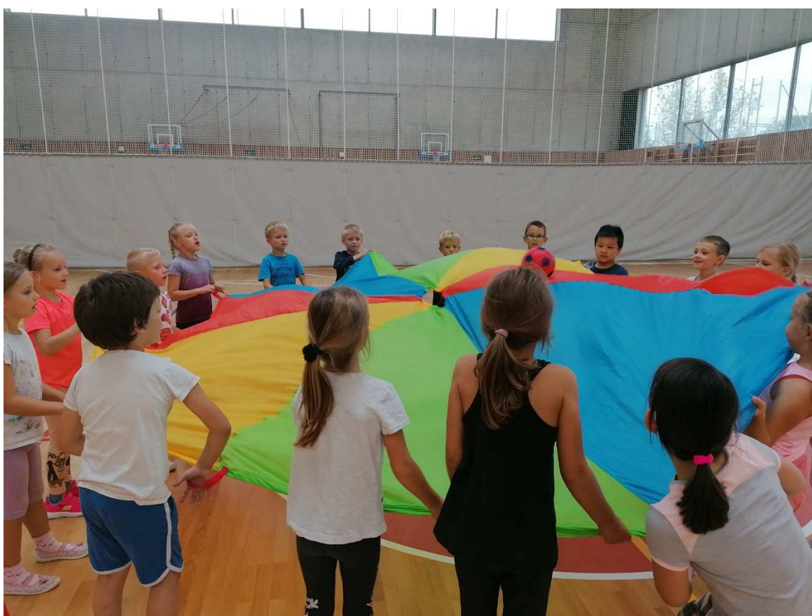
Kooperativní hry s padákem, adaptační aktivity, začátek školního roku

Pokud se na mne nějaký vyučující obrátil, probírali jsme problémy jeho vyučovacích hodin. Pomáhala a konzultovala jsem při tvorbě individuálních vzdělávacích plánů, jejich vyhodnocování. Zajišťovala jsem pořízení pomůcek s NFN, vedu jejich evidenci. Konzultovala jsem poskytování pedagogických intervencí, předmětů speciálně pedagogické péče. Vedla jsem agendu související s asistenty pedagoga.