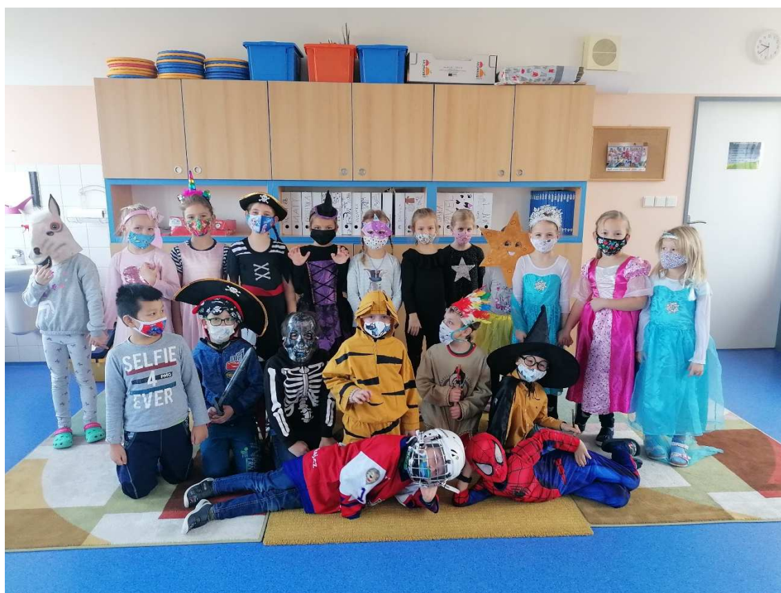
Adaptační aktivity po podzimní distanční výuce

V rámci distanční výuky jsme všichni pracovali na jedné platformě a tou byl a je classroom.