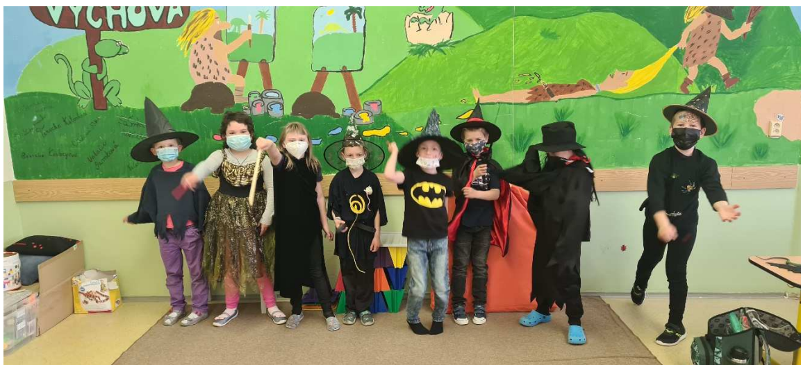
Přípravná třída - čarodějnice