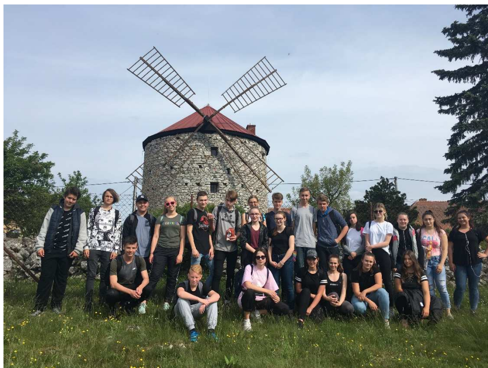
Přírodovědná exkurze Moravský kras