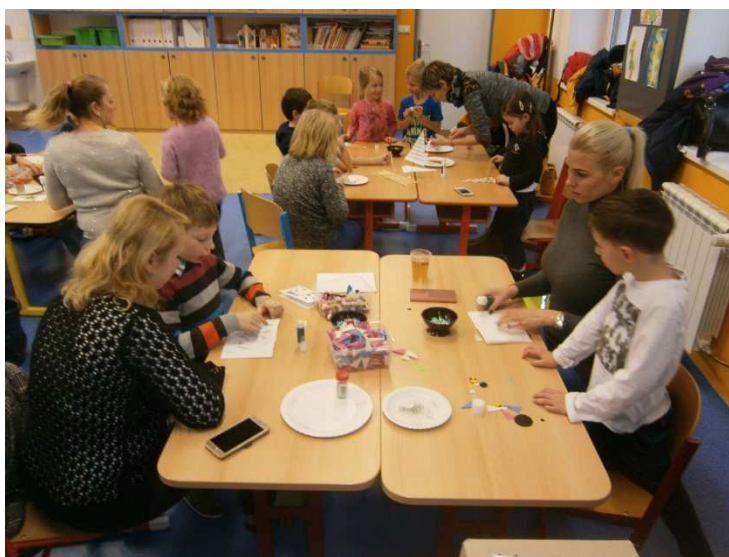
Vánoční tvoření v přípravné třídě

Školní rok jsme slavnostně zahájili 3. září 2018. Do přípravné třídy k prvnímu dni nastoupilo patnáct dětí, deset chlapců a pět dívek. Ve třídě byla asistentka pedagoga, která se podílela na vzdělávání a výchově dětí v přípravné třídě.