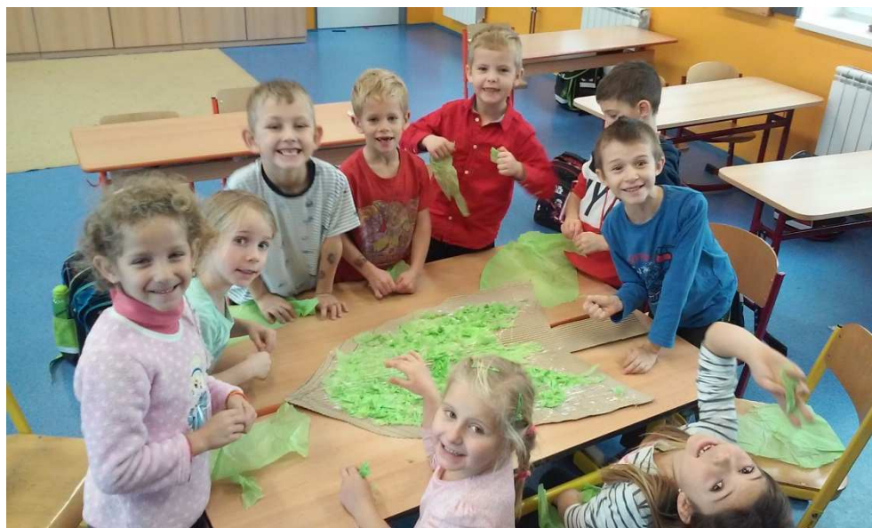
Společná práce na tvorbě papírového stromu

V oblasti materiálně technického zajištění chodu obou budov naší školy došlo v letošním roce k průběžným opravám a inovacím. V rámci projektu IROP byla stávající počítačová učebna vybavena novými počítači, serverem, fyzikální učebna patnácti novými notebooky pro žáky a měřicími přístroji, které se dají připojit do NB. Dále je zmodernizovaná jazyková učebna a v rámci projektu došlo rozšíření možnosti využití venkovních prostor.