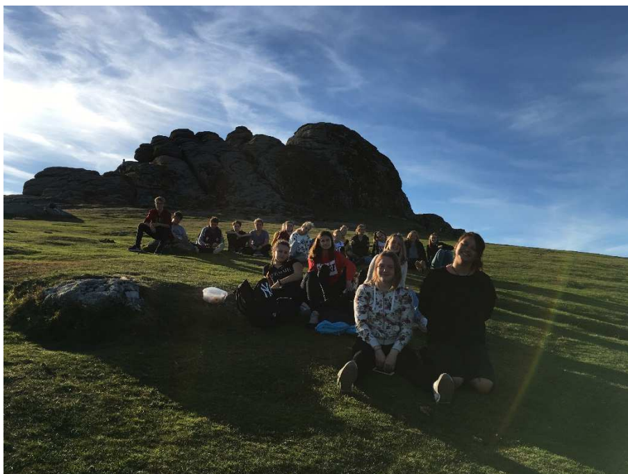
Zájezd do Anglie

Během roku jsme tedy do vyučování zařazovali výukové programy, exkurze a návštěvy kulturních zařízení. Zapojovali jsme děti do vědomostních soutěží, olympiád, hodně se tvořilo, tančilo, zpívalo, recitovalo – s velkým nasazením se hrálo i divadlo. Anglická klasika Strašidlo cantervillské zaujala nejen domácí publikum, ale i porotu Dětské divadelní scény v Brně, Lužánkách. Mladí sportovci pak sbírali zkušenosti i úspěchy v mnoha sportovních soutěžích. Na akcích, které jsme pořádali my nebo které nám ušili na míru naši tradiční partneři – střediska volného času a další organizace, měly děti příležitost poznávat samy sebe i okolní svět. Tak se dělo zejména na výletech, zájezdech a školách v přírodě.