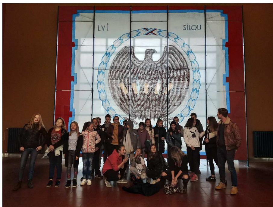
Zájemové dny - Sokol Brno

Součástí vyučovacího procesu byla tedy celá řada doprovodných výukových programů, jež jsou pro výuku velmi důležité a dnes už v podstatě neodmyslitelné. I když jejich celkový výčet uvádíme v kapitole Výukové programy a celoškolní akce, chceme na tomto místě vyzdvihnout zejména spolupráci s modřickou knihovnou, kde se pravidelně konaly humanitně zaměřené výukové programy pro žáky 1. stupně a pro děti školní družiny. Letos jsme vstoupili do projektu CVC Legáto Evaluace za hranice školy - uměním poznáváme svět a absolvovali cyklus výukových programů zaměřených na propojení, procítění a pochopení vztahů a událostí. Žáci nejvyšších ročníků navštívili v rámci projektu „PolyGram – Podpora polytechnického vzdělávání, matematické a čtenářské gramotnosti v Jihomoravském kraji“ Střední školu grafickou Šmahova Brno. Poznatky z přírodních věd včetně zajímavých pokusů si vyzkoušeli v rámci spolupráce s PF MU i v rámci návštěv VIDA centra apod. Programy přírodovědného charakteru pak nabízela centra volného času. Námi nejčastěji oslovanými bylo SVC Ivančice, které zaštiťovalo a zabezpečovalo i lyžařský zájezd a některé školy v přírodě, naše škola zase této organizaci nabídla své prostory pro průběh okresních kol zeměpisné olympiády a olympiád z českého a anglického jazyka.