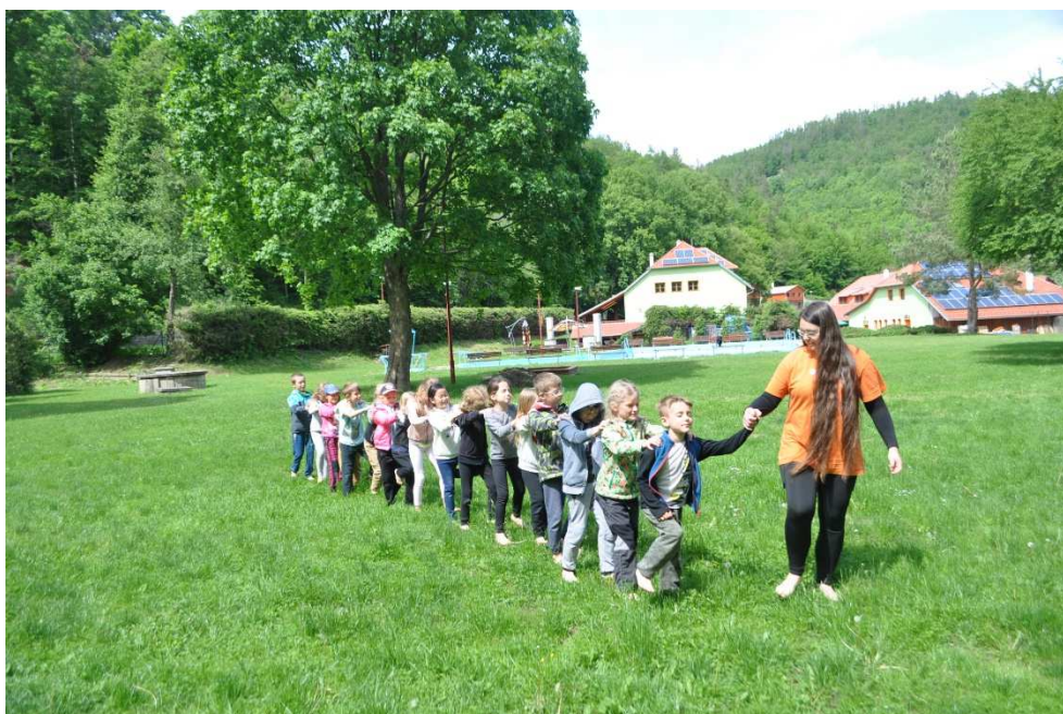
Škola v přírodě 1. ročník