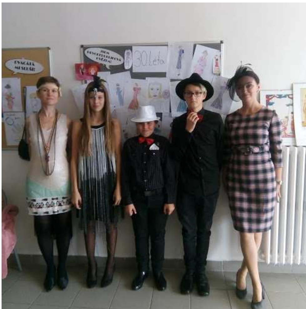
Projekt První republika – móda