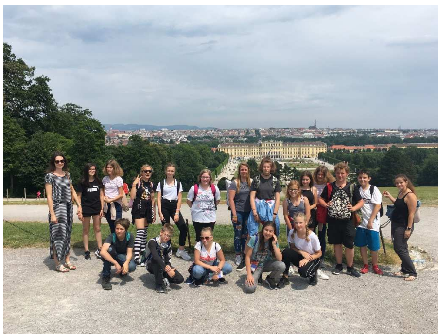
Vídeň - akce školního parlamentu

Mezi nejzdařilejší akce zaručeně patří Barevný týden, do kterého se zapojila celá budova Benešova. Nejšikovnější třída prakticky neztratila žádný celý bod. Jediný, kdo žákům mohl konkurovat, byli správní zaměstnanci, kteří se do soutěže zapojili také.