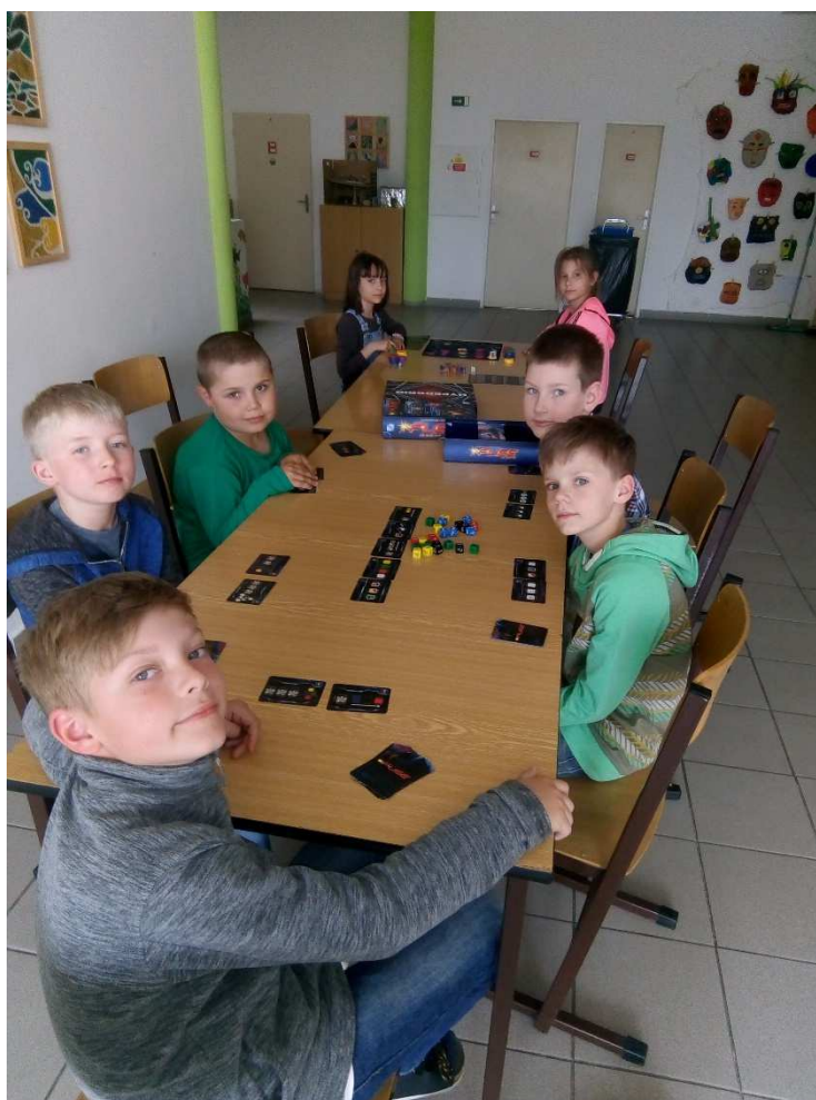
Kroužek zábavné logiky a deskových her

Pro první stupeň probíhaly relaxační skupinky, a to pro žáky hyperaktivní, s poruchami pozornosti a žáky úzkostné. Na základě zpětné vazby vyučujících má smysl v této psychologické službě pokračovat i v příštím školním roce. Žáci se vrací do výuky odpočatí a koncentrování.