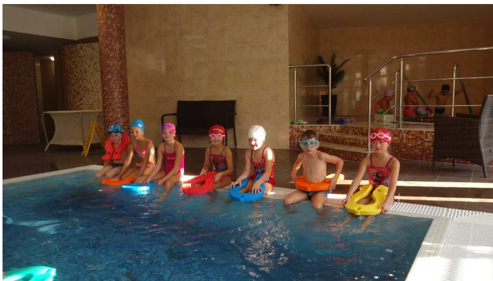
Plavecký výcvik Hastrmánek