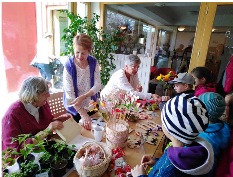
ŠD Podpora seniorů v PBDS - velikonoční jarmark