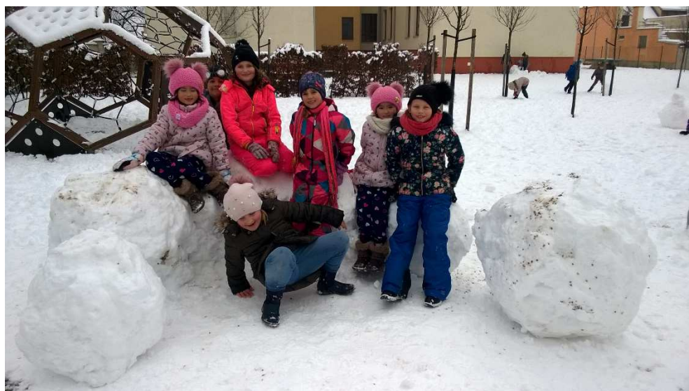
Zimní dovádění na sněhu

Nabídnutý provoz ŠD o podzimních, vánočních, jarních, velikonočních prázdninách se pro malý zájem neuskutečnil, průměrně přihlášených 5 žáků. Provoz o letních prázdninách formou příměstského tábora v nabídce dvou týdnů se neuskutečnil - 5. přihlášených, 3 odevzdané předběžné přihlášky.