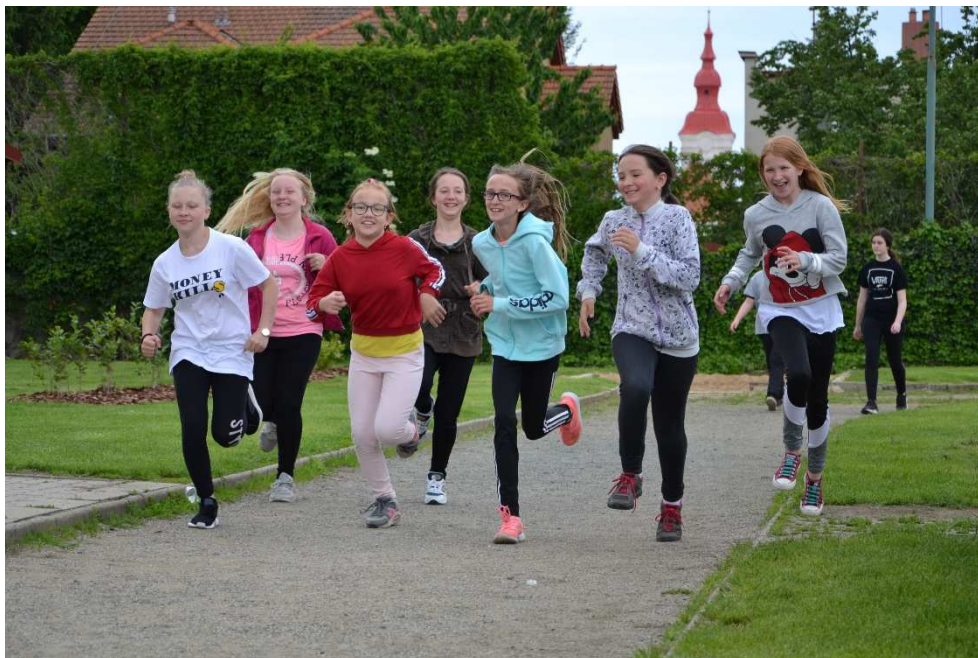
Run and Help