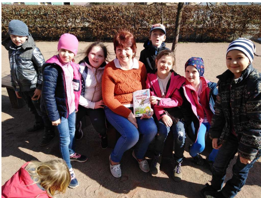
Čteme s babičkou a dědečkem

Školní družina pracovala v prostorách těchto tříd: 1. oddělení ve třídě přípravného ročníku, 2. oddělení v 1.C, 3. oddělení ve 3.B, 4. oddělení ve 2.B, 5. oddělení samostatná třída ŠD a 6. oddělení ve 2.C. Provoz ranní družiny od 6:30hodin v 5. , a 1. oddělení. V každé uvedené učebně se nachází telefon, který umožňuje kontakt s rodinnými příslušníky žáků ŠD a kamera umožňující vizuální kontrolu. Nově máme zavedenou docházku přes systém Bellhop, provozován společností NeurlT s.r.o. Rodiče si děti vyzvedávají pomocí čipů.