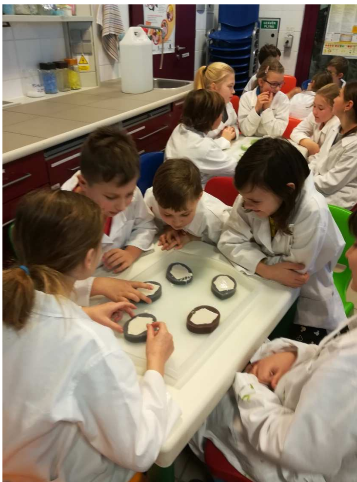
Výukový program na MU Bioskop

měsících v areálu školy. Dále pak jsme využívali cvičebnu v budově školy na Komenského ulici a venkovní sportoviště, v prvním pololetí probíhala na plaveckém stadionu v Kohoutovicích pro žáky 2. a 3. ročníků výuka plavání.