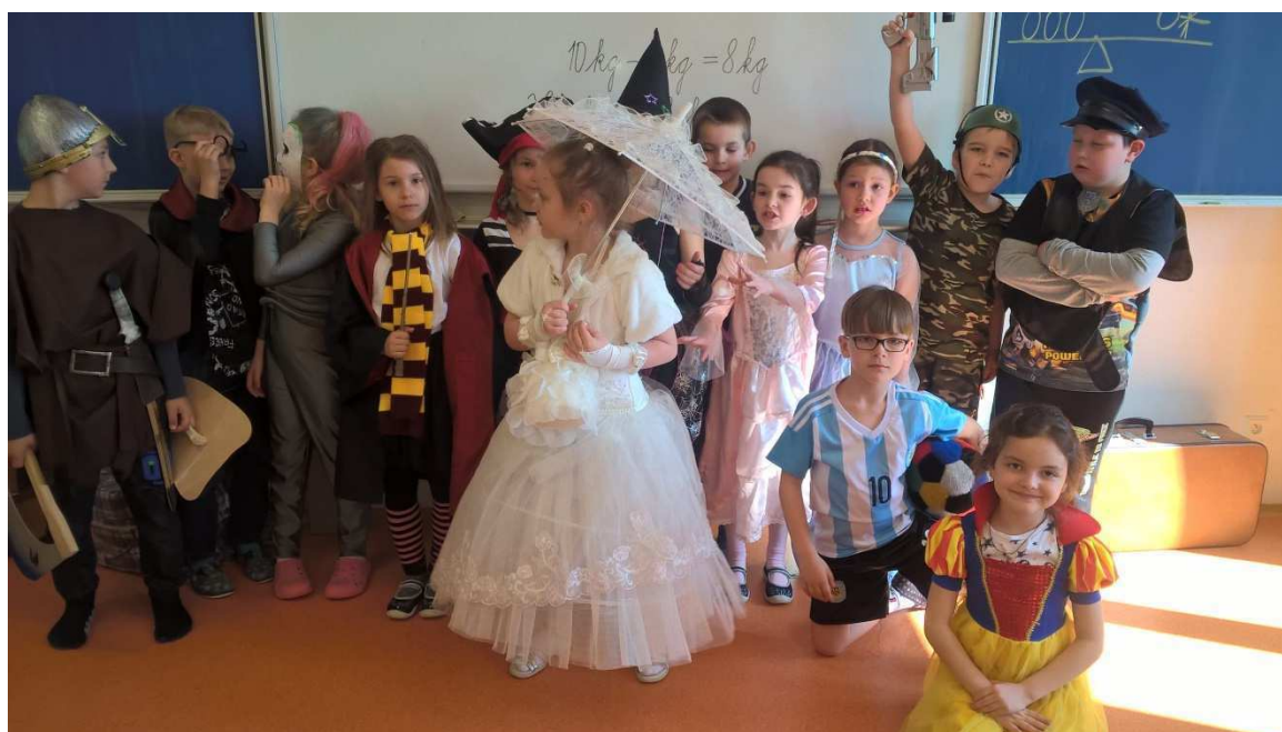
Žakovský projekt - Karneval