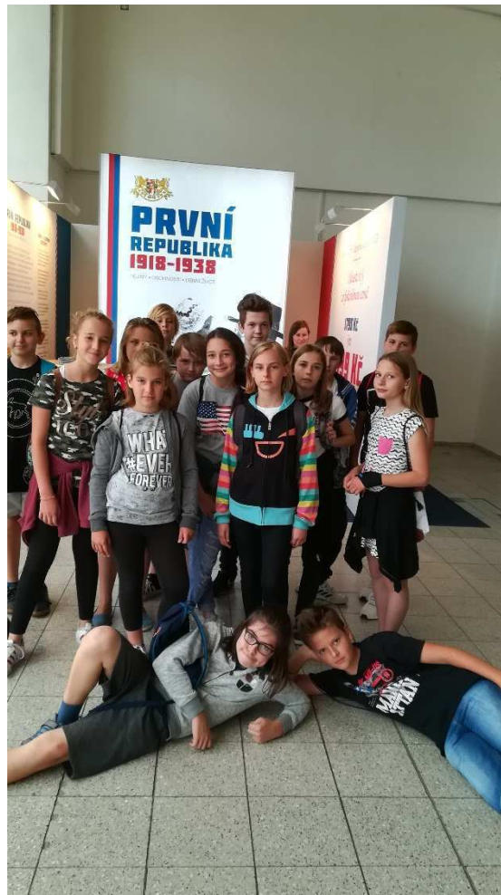
V.A na BVV

Během uplynulého školního roku se uskutečnila dvě setkání školské rady. Dne 19.4.2018 se konaly volby do školské rady. Z řad rodičů vzešli tři kandidáti, z nichž byli dva zvoleni za členy ŠR. Dne 15.10.2018 byla projednána a schválena Výroční zpráva za školní rok 2017/2018, dále byly prodiskutovány provozní záležitosti školy z pohledu rodičů, zastupitelů města i zástupců školy.