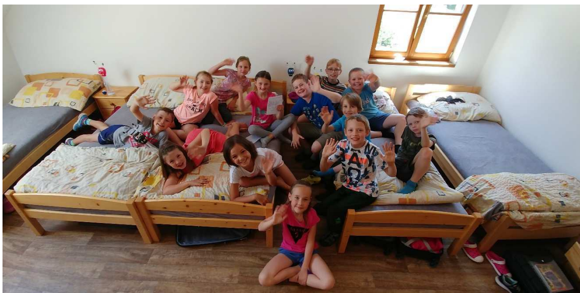
Škola v přírodě - Halův mlýn