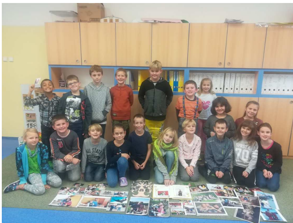
Projektový den - Rodina