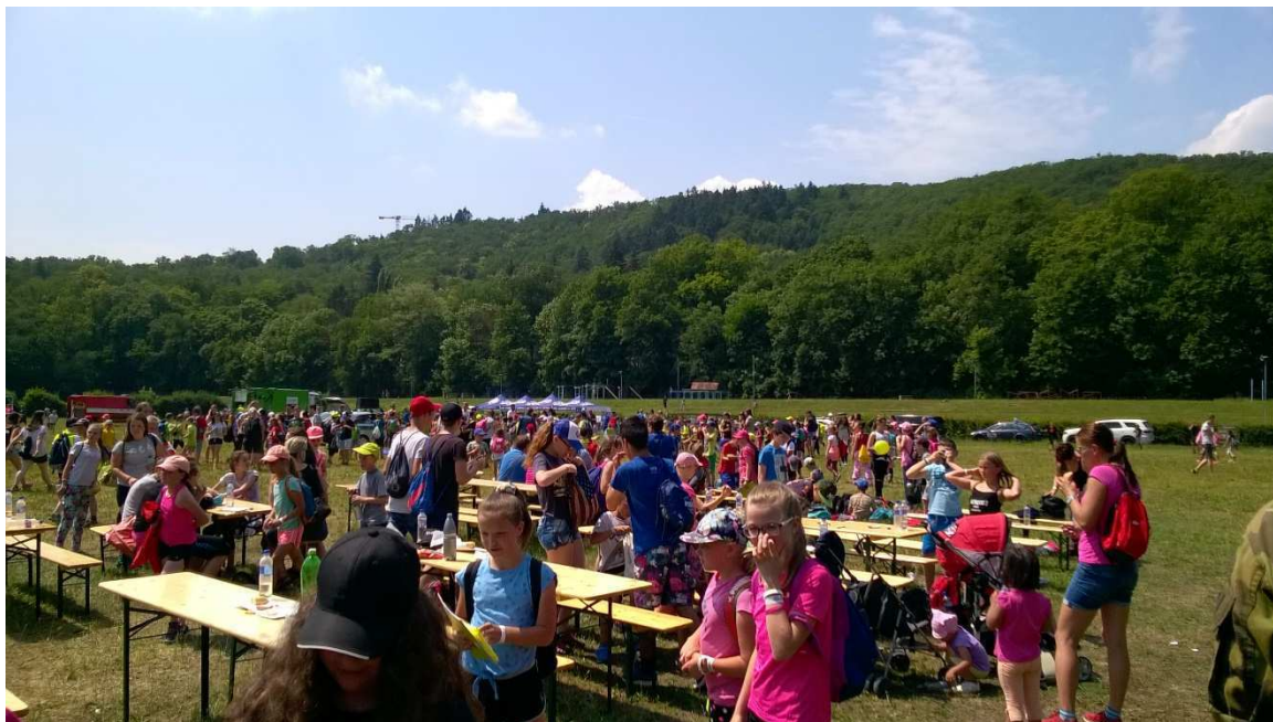
Ekoden s Kometou

Hodnocení je pro přehlednost rozčleněno do jednotlivých bloků s blízkými tématy: