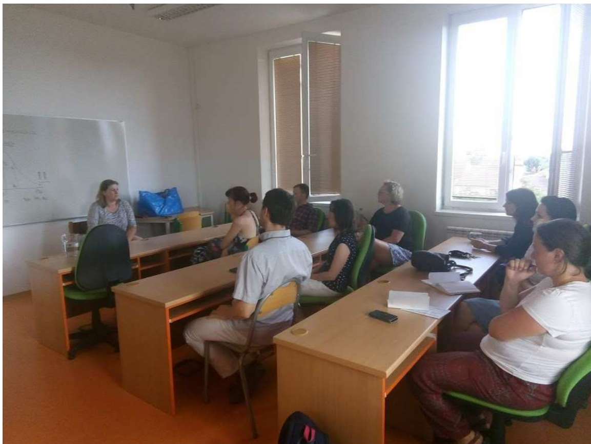
Beseda s rodiči - Mensa

Na konci školního roku proběhla rediagnostika, abychom mohli vyhodnotit společné úsilí. Většina žáků z přípravného ročníku prokázala, že dohnala dílčí nedostatky a mohou tak kvalitně připraveni nastoupit do první třídy