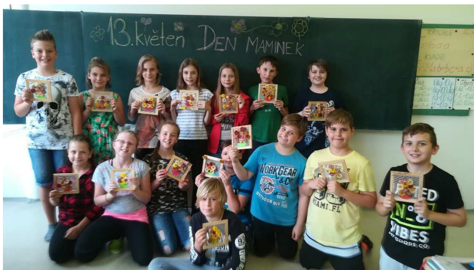
Tvorba ke Dni matek

V letošním školním roce jsme v rámci vzájemného propojení a kvalitnějšího předávání informací začali pracovat v systému edookit. Přešli jsme tak plně na elektronickou komunikaci i vedení školské dokumentace. Díky našemu Edoušovi jsou rodiče podrobně informováni o průběhu vzdělávání, o učivu, známkách, domácích úlohách, školních akcích, zkrátka o všem podstatném, co se ve škole odehrává. Poskytují nám též rychlou zpětnou vazbu např. při omlouvání absence apod. Nemají-li rodiče možnost připojení na tento elektronický systém, je možné využít i klasický způsob komunikace přes kontaktní deníky, deníčky a žákovské knížky, ale to dnes už děje minimálně. Zajímavosti, fotografie a komentáře z dění ve škole lze stále nalézt na webových stránkách školy i v modřickém Zpravodaji. Nic ovšem nenahradí přímý kontakt, proto stále rodiče rádi vítáme na třídních schůzkách, hovorových hodinách, či osobních konzultacích.