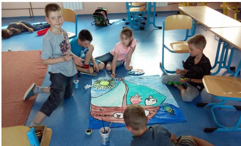
Družina - společná práce - prázdninová loď