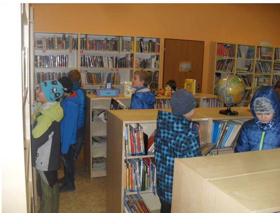
Družina v knihovně

Tento rok nastoupilo v září do školní družiny 174 žáků. Po odhlášení odstěhovaných i starších žáků jich zůstalo v červnu 166. Ze 166 žáků bylo 71 děvčat a 95 chlapců. Byly plánované a realizované jednotlivé aktivity dle ŠVP pro školní družinu „Rok v jeho proměnách.“ Při společných aktivitách dbáme na přátelskou komunikaci a upevňování vztahů mezi sebou. Žákům je nabídnuta možnost kreativní výtvarné práce, pohyb na školním hřišti, školní zahradě s herními prvky, využití sportovní haly v zimním období, odpočinková relaxace.