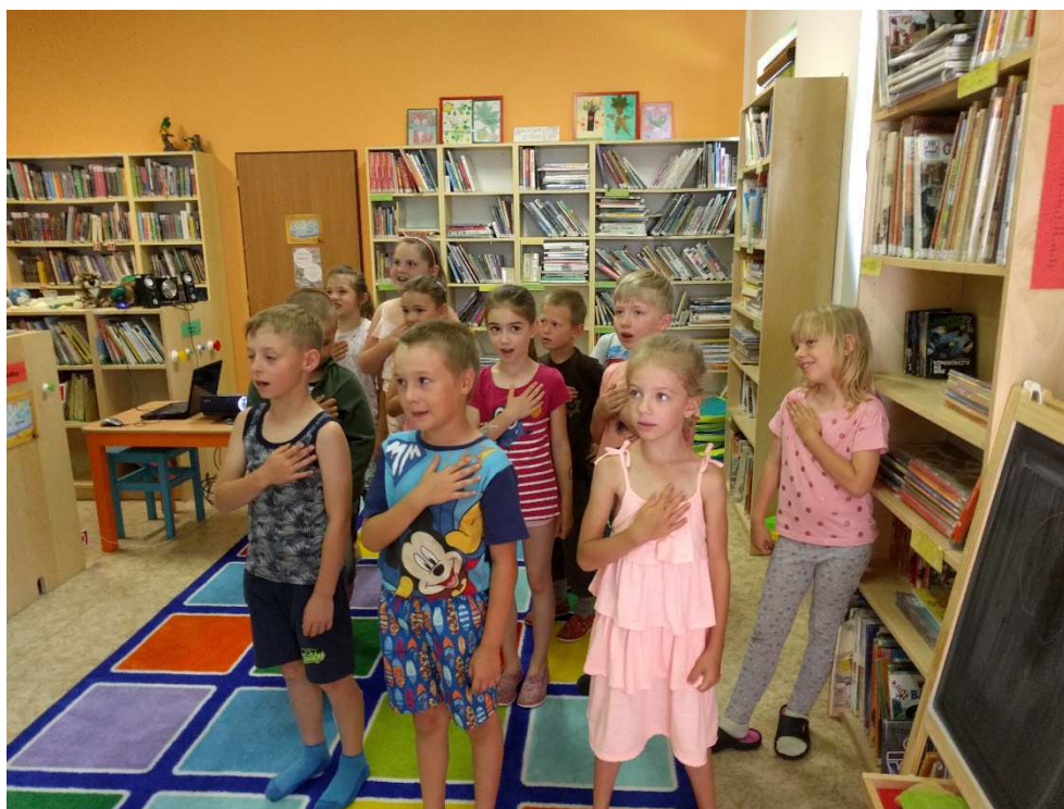
Pasování prvňáčků na čtenáře

Klasicky jsme do vyučování zařazovali výukové programy, výlety, exkurze a návštěvy kulturních zařízení. Zapojovali jsme děti do vědomostních soutěží, olympiád, hodně se malovalo, tančilo, zpívalo, recitovalo – hrálo se i divadlo. Mladí sportovci pak sbírali zkušenosti v mnoha sportovních disciplínách. Na akcích, které jsme pořádali my nebo které nám ušili na míru naši tradiční partneři – střediska volného času a další organizace, měly děti příležitost poznávat samy sebe i okolní svět. Tak se dělo zejména na vícedenních výletech, zájezdech a školách v přírodě.