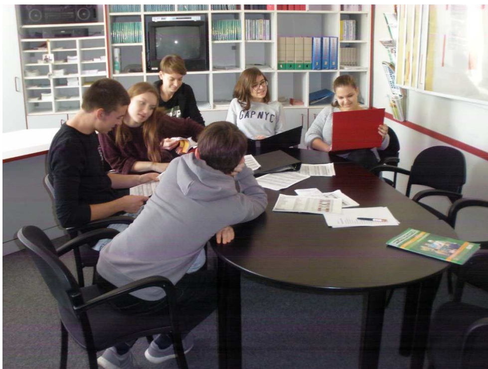
Návštěva úřadu práce

V rámci osobnostního rozvoje žáků pak byly vybrány čtvrté a páté třídy pro program Tvořivý deník, v němž bylo pracováno s emocemi žáků pro pozvednutí sebevědomí. Program se i v minulých letech prokázal jako nejprospěšnější právě v období prepuberty, kdy děti řeší svoji sebehodnotu dle tělesného schématu a intelektu a stávají se v tomto ohledu zranitelnější. Možno jej tedy vnímat i jako program preventivní proti sebepoškozování, anorexii apod.