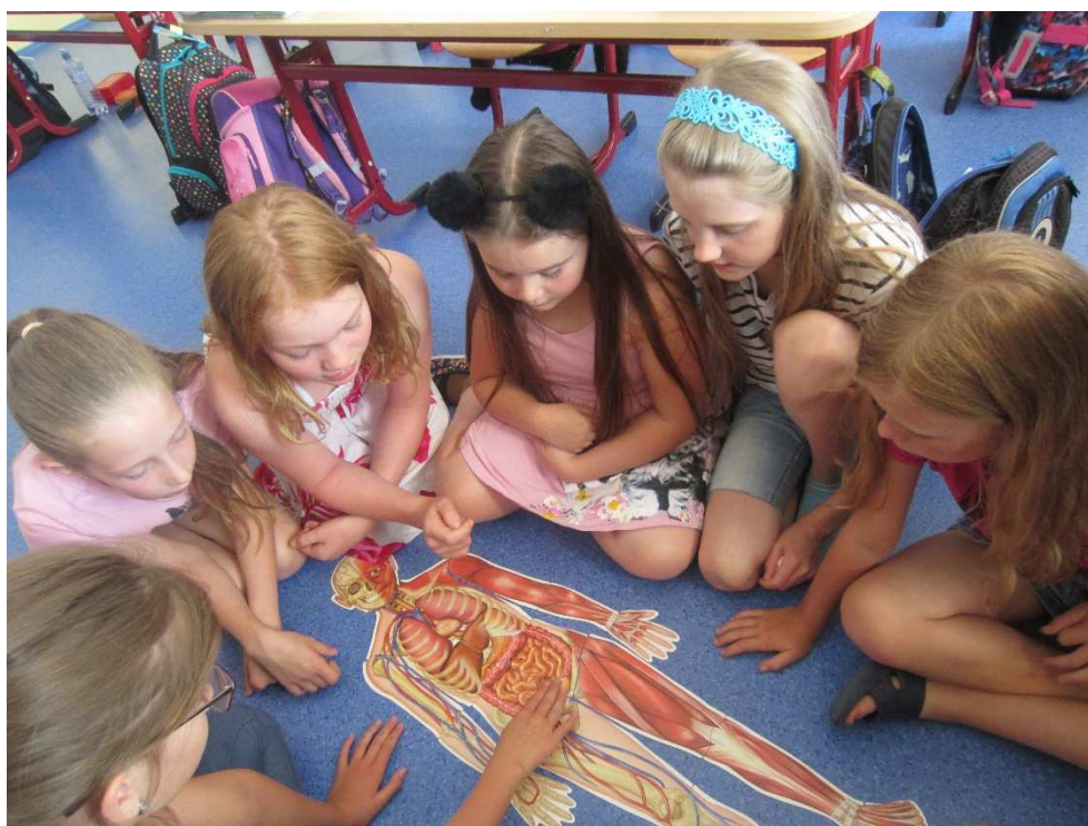
Poznáváme lidské tělo

Výchovné problémy jsme se snažili řešit vždy okamžitě, bez prodlení. Třídní učitelé, školní psycholožka, výchovná poradkyně a především preventista patologických jevů spolupracovali navzájem i s rodiči, v případě potřeby se obraceli na pracovníky sociální péče tak, aby došlo k objasnění a nápravě.