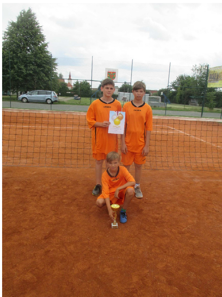
Přebor škol v nehejbalu trojic