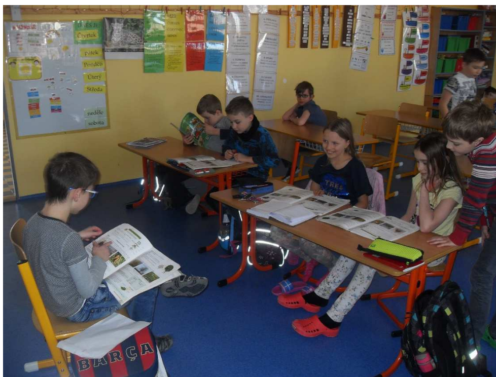
Družina - příprava na prvouku