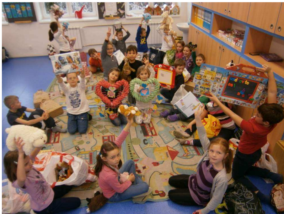
Děti dětem - dárky onkologicky nemocným dětem

Vzhledem k očekávanému navýšení počtu žáků naší školy jsme letos vyřešili příslušné administrativní úkony související se zvýšením kapacity školy na počet 400 žáků, školní družiny na 150 žáků a školní jídelny na 500 strážníků.