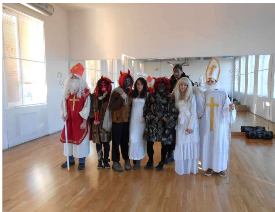
Mikulášská nadílka od SRPŠ

Rodiče mohou školu navštívit kdykoliv po vzájemné dohodě s vyučujícím, v době konzultačních hodin, na třídních schůzkách nebo v úředních dnech (je-li vhodné, mohou být žáci přítomni při jednání rodičů a učitele). O činnosti a aktivitách školy jsou rodiče pravidelně informováni na webových stránkách školy a v modřickém Zpravodaji.