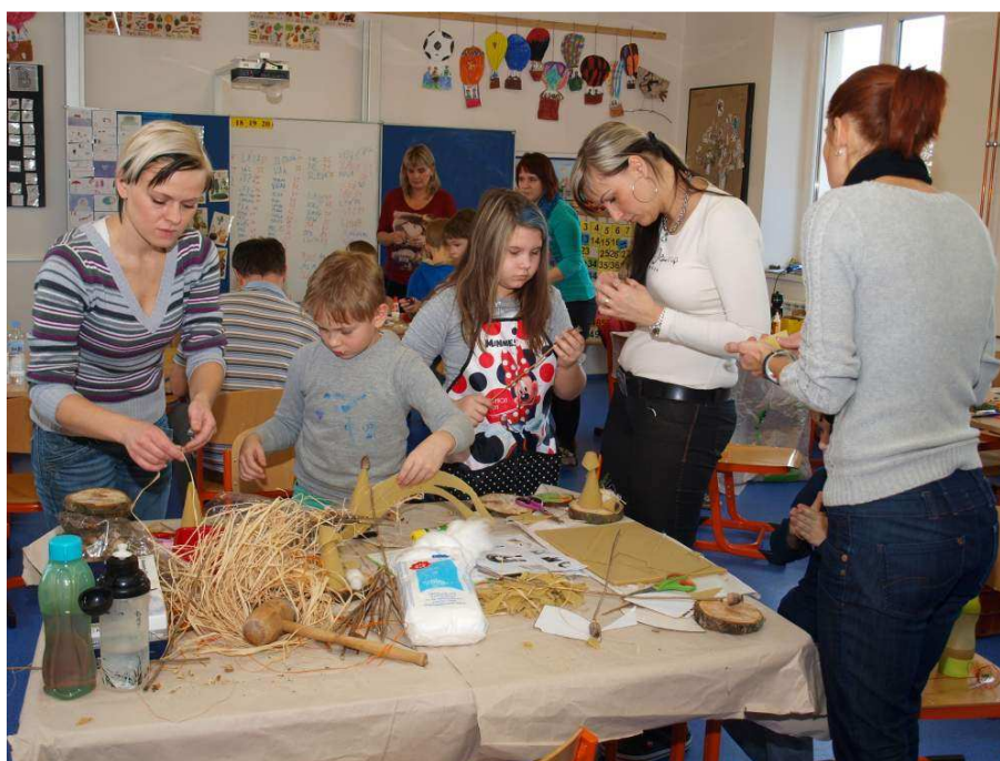
Vánoční tvoření s rodiči