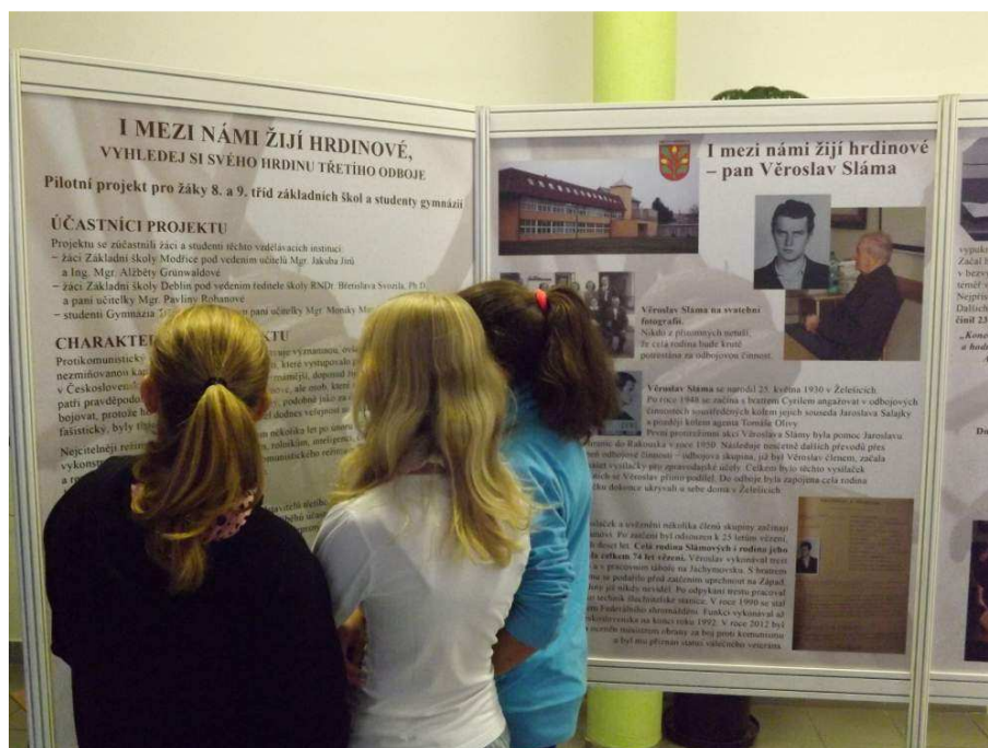
Výstava "I mezi námi žijí hrdinové"