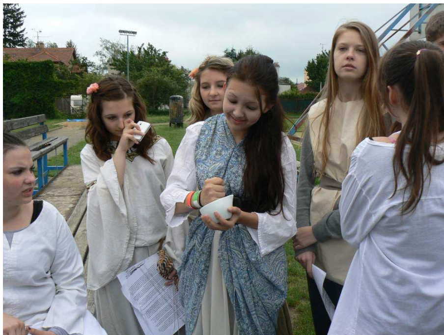
Projekt "Putování ve středověku s Geoffrey Chaucerem"

V uplynulém školním roce vydala ředitelka školy rozhodnutí podle § 49 odst. 1, § 165 odst. 2 písm. e, a § 183 odst. 1 zákona č. 561/2004 Sb., o předškolním, základním, středním, vyšším odborném a jiném vzdělávání (školský zákon), a v souladu se zákonem č. 500/2004 Sb., správní řád dle uvedené tabulky. Proti těmto rozhodnutím nebylo podáno žádné odvolání.