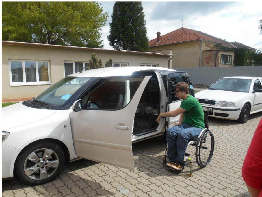
Prevence úrazů páteře a míchy

Žáci 8. a 9. tříd se zapojili do akcí konaných pod názvem Brno a jižní Morava bez hranic, kde se učí žít s mentálně a tělesně postiženými spoluobčany.