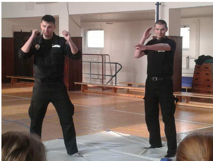
Kurz sebeobrany s MP