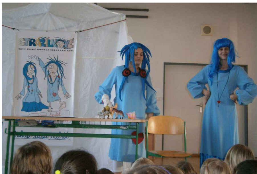
Divadelní představení "Strážilkové"