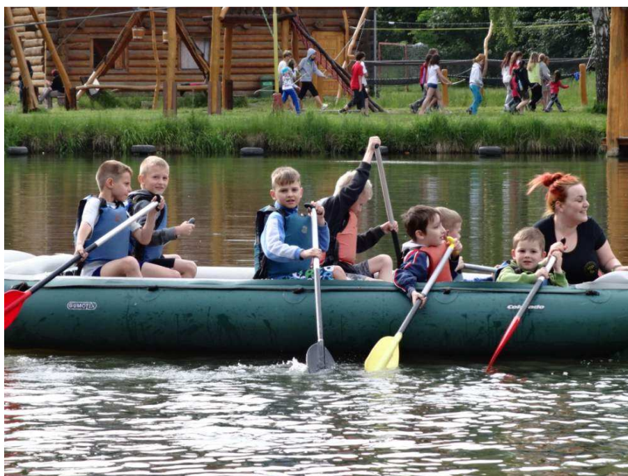
Škola v přírodě – Březová