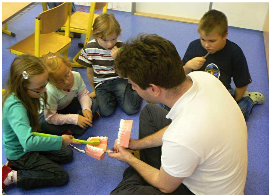
Jak si správně čistit zuby