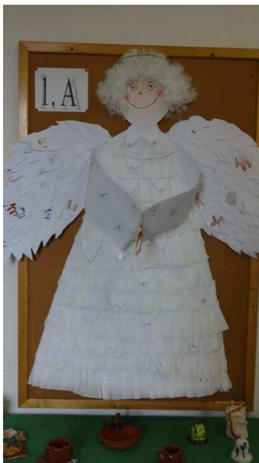
Soutěž o nejkrásnějšího anděla

Každým rokem přibude do naší kuchyně nějaké nové zařízení, které nahradí stávající staré a kapacitně nevyhovující. V letošním roce je to především nový konvektomat, ve kterém lze připravit pokrmy za kratší dobu a zdravěji, jen s malým množstvím tuku a téměř bez ztráty hmotnosti.