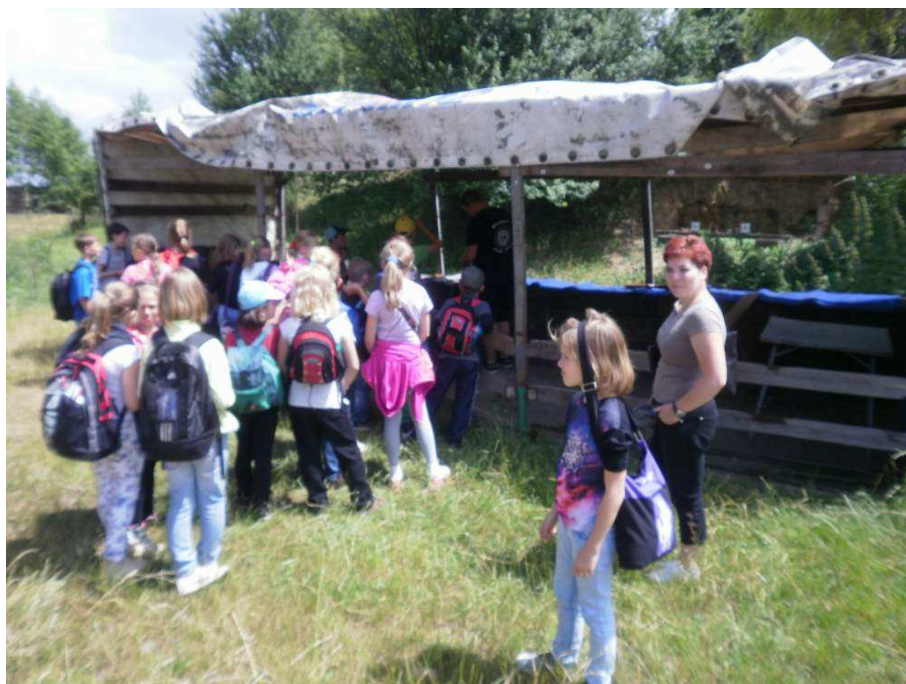
Návštěva Army Parku v Ořechově