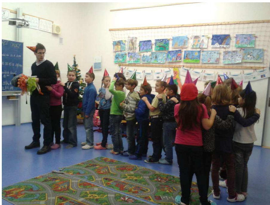
Škola tajemství pohybu a krásy