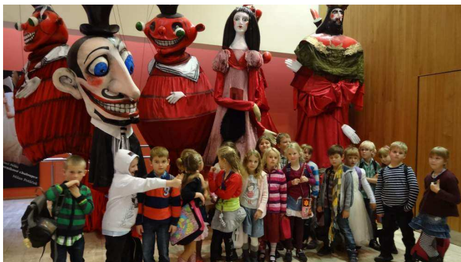
Prvníáci v divadle