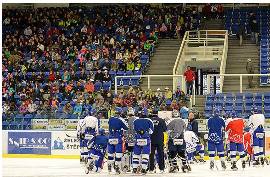
Eko den s Kometou

Všechny aktivity byly prezentovány na školním webu, školních nástěnkách a některé i v místním modřickém Zpravodaji.