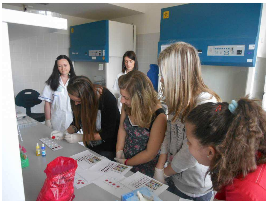
Návštěva Masarykova onkologického ústavu

Stížnosti v oblasti pracovněprávních vztahů nebyly podány.