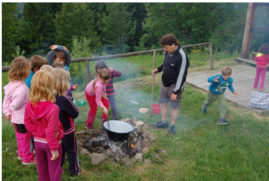
Škola v přírodě

Zákonní zástupci byli průběžně informováni o prospěchu žáků prostřednictvím deníčků, žákovských knížek, či webových stránek školy, na kterých je umístěna elektronická žákovská knížka. Rovněž žáci na 2. stupni mohli na těchto stránkách aktuálně sledovat svou klasifikaci ze všech předmětů. Na webových stránkách naší školy jsou dostupné všechny podstatné informace a dokumenty o činnosti školy, naleznete zde pozvánky na připravované akce a u těch již zrealizovaných nechybí fotogalerie s komentáři, mnohdy žákovskými. Komunikace s rodiči pak probíhala i přímo, tedy na třídních schůzkách, hovorových hodinách, či osobních konzultacích.