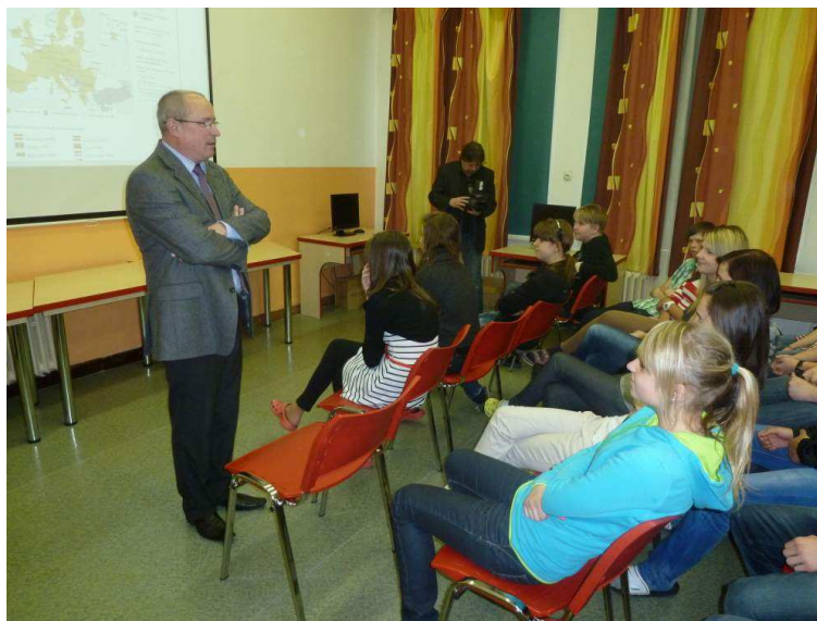
Návštěva europoslance Ivo Strejčka