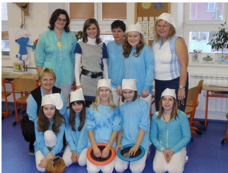
Zápis do 1. tříd