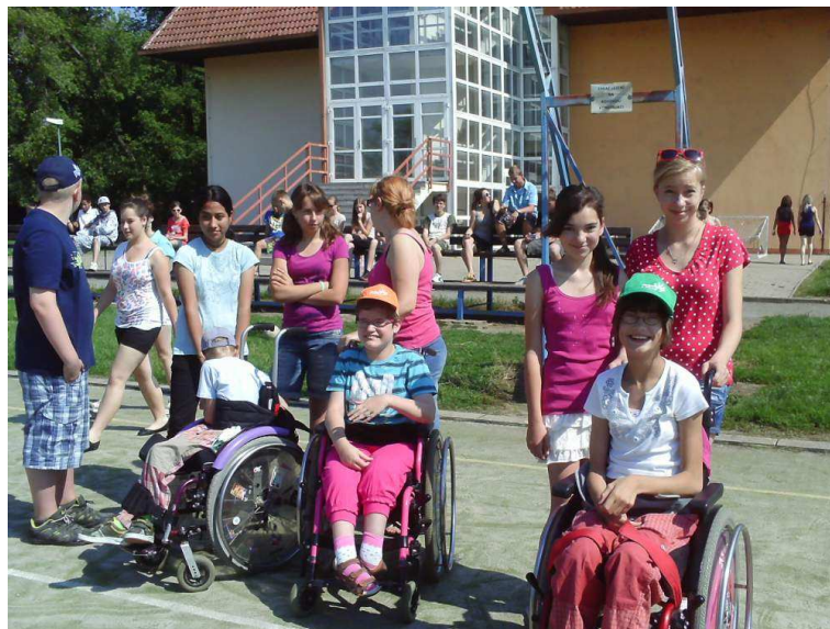
Kociánka v Modřicích

Veškeré dění ve škole je možné sledovat na našich webových stránkách, komentáře k nejdůležitějším událostech publikujeme též v modřickém Zpravodaji.