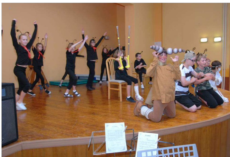
Školní akademie – Polámal se mraveneček