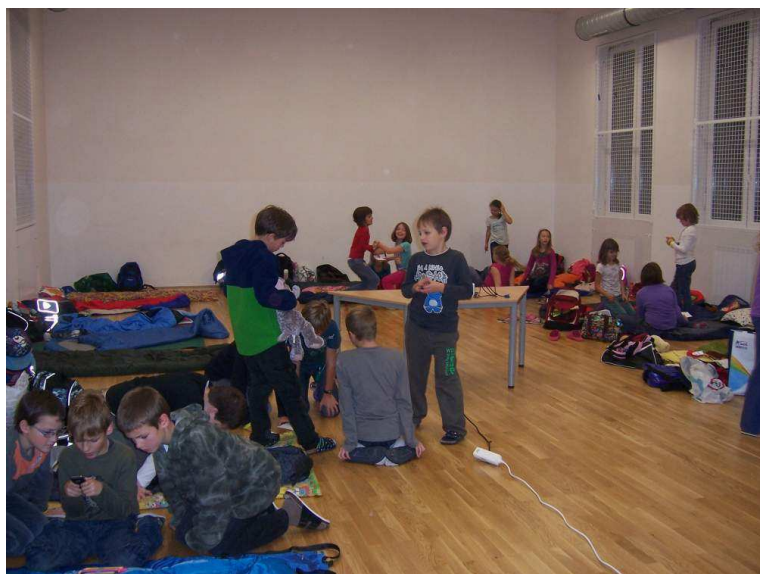
Nocování ve škole: Halloween aneb Angličtina trochu jinak