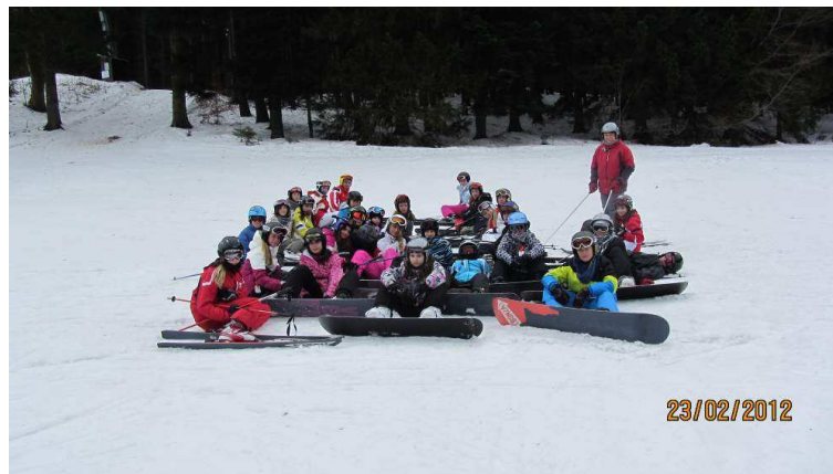
Lyžařský a snowboardový kurz

Účastnili jsme se se svými prezentacemi výstavy k výročí založení české školy v Modřicích.