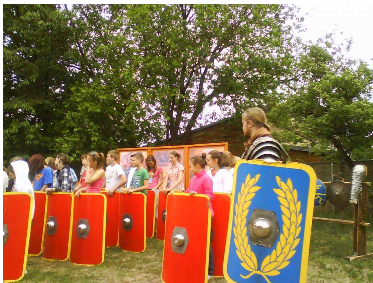
Římští gladiátoři - interaktivní divadelní představení