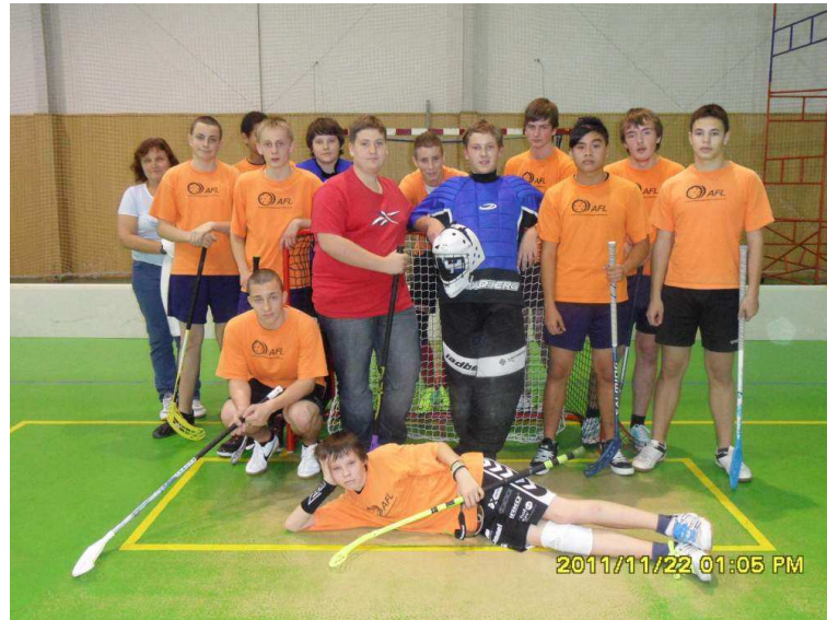
Orion Florbal Cup

Spolupráce s rodiči se velmi efektivně rozvíjela v rámci SRPŠ, komunikace vedení školy a výchovné poradkyně a učitelů s rodiči probíhala standardním způsobem, tj. především ústním projednáváním. V letošním roce se uskutečnila volba členů školské rady, konaly se její pravidelné schůzky.