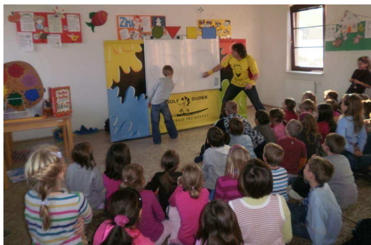
Beseda v knihovně