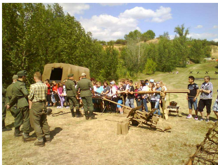
Den vojenské historie Rostov 1942