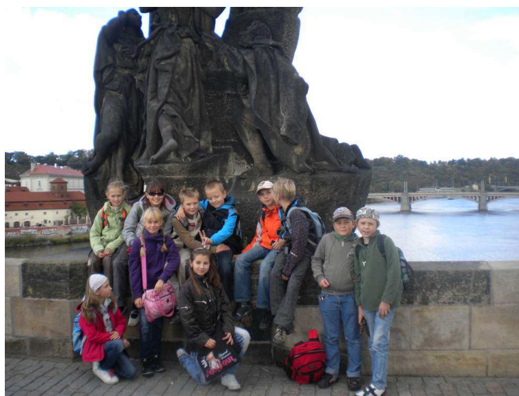
Výlet do Prahy

Z výčtu absolvovaných seminářů vyplývá, že o DVPP je ze strany pedagogů stále velký zájem. Ve výběru vzdělávacích seminářů jsme upřednostňovali především ty, které byly zaměřeny na metody činnostního učení, na rozvoj čtenářské a matematické gramotnosti a informačních technologií. V rámci tvorby výukových materiálů projektu Peníze do škol využívali učitelé seminářů dle svých aprobačních zaměření tak, aby nabyté poznatky mohli volně aplikovat ve své praxi. Velká pozornost byla tradičně věnována zefektivnění výuky anglického jazyka, ale i prevenci patologických jevů a výchovnému poradenství.