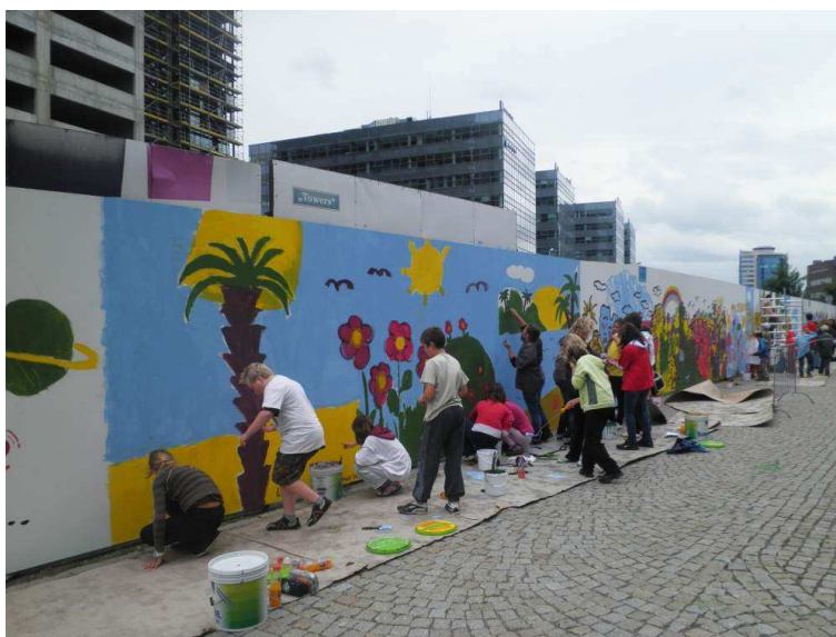
COLORS OF SPILBERK - Malba na zdi

V tomto školním roce se plně realizoval projekt EU Peníze školám, který byl mimo jiné zaměřen na tvorbu výukových materiálů, tzv. šablon, jež měly podporovat čtenářskou a finanční gramotnost žáků. Hospitační činnost tedy sledovala kvalitu těchto pracovních materiálů, jejich realizaci v praxi.