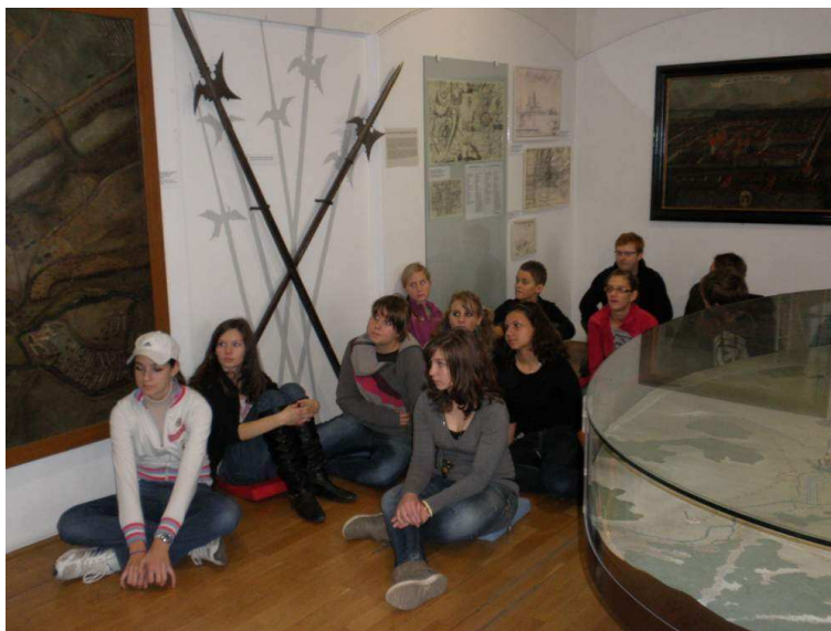
Špilberk - Třicetiletá válka v Brně a Modřicích